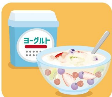
フルーツポンチは、プレーンヨーグルトをりんごジュースの半量入れるとプルプルとして、さっぱりな味わいが楽しめます

て少し炭酸水を加えてしゅわつとさせると良いですよ。 ●りんごジュースのようかんは、鍋にりんごジュースと粉寒天を入れて溶かし、グラニュー糖を入れて弱火でゆつくりかき混ぜます。2、3分煮たら、白こしあんを少しずつ加え、なめらかになるまで混ぜたら火を止めます。少し冷めたら、ラップを敷いた深型の皿などに流し込んで冷蔵庫で1時間ほど冷やし固めます。