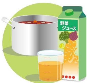
カレーをつくる時、野菜ジュースは入れ過ぎると酸味が立つので、水と同量が少し少ないくらいが良いです

ので、料理にオススメです。●パンケーキをつくる時、水の代わりにホットケーキミックスと合わせる